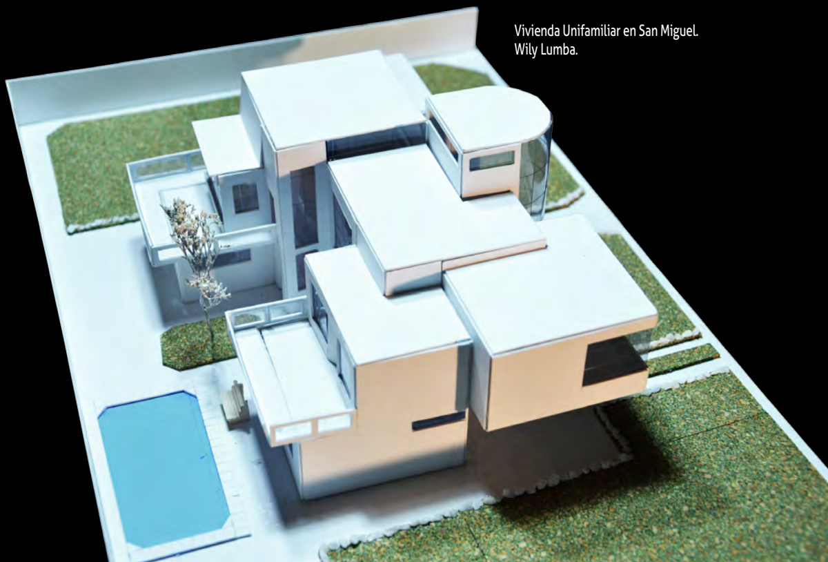
Vivienda Unifamiliar en San Miguel. Wily Lumba.

Los alumnos llegaron a ser autónomos en su proceso de diseño y comprensión del problema inicial, motivándose desde el inicio y fortaleciendo su responsabilidad y autoestima. Sin embargo, algunos de ellos que llegaron con nociones desacertadas, las cuales tuvieron que ser desaprendidas, en su proceso, no fueron eficaces en el manejo de sus tiempos para cumplir con este proyecto, lo cual los llevó a retirarse o desaprobar la asignatura al presentarlo con una culminación insustancial, presentando también una asistencia irregular e inconstante. Ellos requerirán un apoyo o refuerzo, lo cual tengo entendido se está dando en este verano.