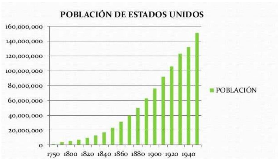
Figura 1. Crecimiento demográfico de Estados Unidos desde 1750 a 1950. 23

Estados Unidos aprobó su constitución el 17 de setiembre de 1787 su constitución, en el cual se establece una separación del poder civil y religioso y la libertad religiosa. Esta nación estaba relacionada con Cristo porque sus primeros habitantes fueron cristianos y se realizaron dos grandes reavivamientos religiosos (la primera en la década de 1930 y la segunda alrededor de 1800). Estos despertares religiosos sacudieron Norteamérica y tuvo repercusión internacional, que dio origen al pietismo en Alemania y al metodismo en Inglaterra.