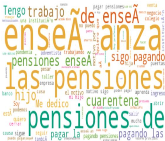
Figura 3. Análisis del pensamiento y palabras frecuentes de los participantes.

Según la tabla 3 mediante el análisis del Textgeneration, este es el texto principal, el punto medio de todas las entrevistas. Podemos afirmar que los responsables financieros hicieron lo posible para poder seguir pagando las pensiones de enseñanza, ya que, algunos mencionaban que la institución tenía principios y valores, a la vez otros decían que no querían que pierdan el año académico. Según E027 que dice “ estamos priorizando los estudios” de igual manera E016 dice “es una institución privada adventista, donde la enseñanza, por el cual estoy pagando las pensiones de enseñanza de mi hija”, según E003 dice “ Tuve que cerrar el taller”, E018 dice “Por el cual sigo pagando las pensiones de enseñanza”, E007 dice “No salir y el miedo de contagiarme de la enfermedad a pesar que ya están permitiendo salir con todas las precauciones”, E006 dice “No puedo pagar las pensiones de enseñanza”, E017 dice “Me dedico a la venta de artesanía, pero por la cuarentena no hay ingresos para poder pagar las pensiones de mi hijo”, E015 dice “Soy carpintero, pero yo quiero que mi hijo aprenda y pueda terminar el año académico”.