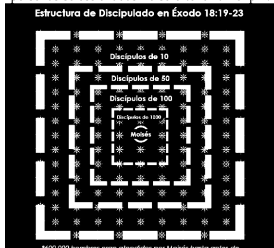
Figura 1. Discipulado en el libro de Éxodo

El discipulado también tiene como objetivo el desarrollo del discípulo. Sin embargo, esto no ocurre de manera independiente ni se deja a la iniciativa o creatividad de cada discípulo. Por eso se propone una estructura simple y dinámica, donde cada discípulo, también llamado juez por la función que cumpliría, atiende a otros. El texto dice: “ponlos al frente del pueblo como líderes de millares, centenas, cincuenta y de decenas” (v. 21c). Las personas seleccionadas no solo tendrían el privilegio de ser discipulados,